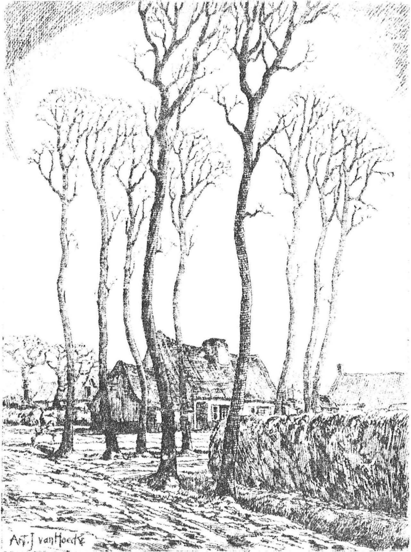
Retrospectieve Ant. J. Van Hoecke